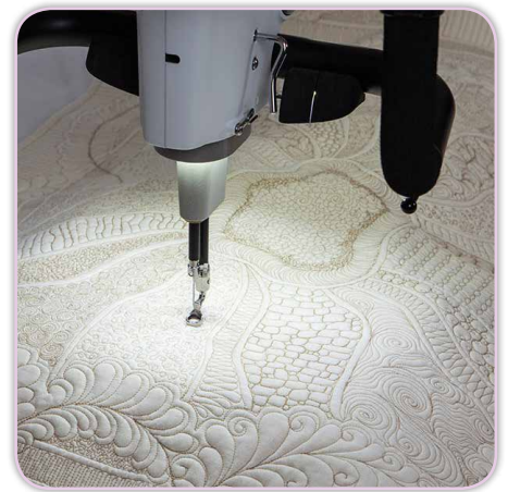
LED-Licht im Quiltbereich