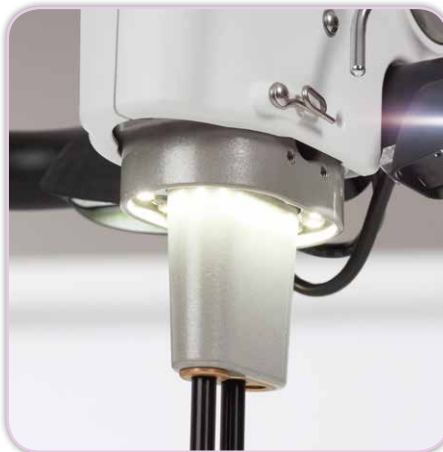
LED-Lichtring im Nadelbereich, warmes und UV-Licht