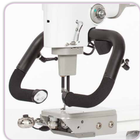
Integrierte Comfort-Fit™ Micro Handles