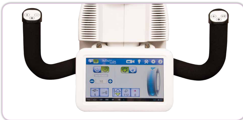
Bedienelement am hinteren Maschinenkopf mit farbigem Touchscreen, leichte Handhabung durch Knöpfe auf den Griffen