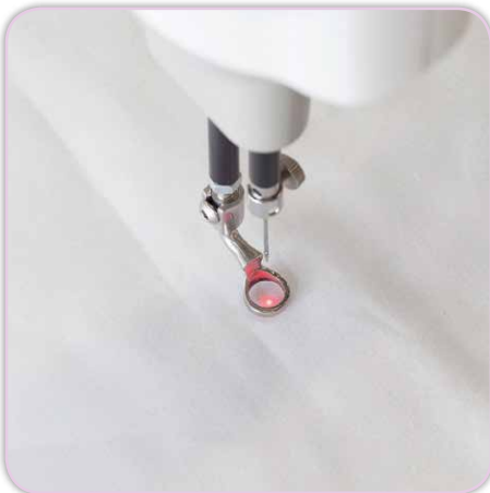
Punktlaser im Nadelbereich

Lieben Sie es zu quilten? Dann werden Sie auch die HQ Infinity 26 lieben! Neben der großen Arbeitsfläche und den bereits genannten Highlights muss die einzigartige Lichtvielfalt hervorgehoben werden. Gerade beim Quilting - egal zu welcher Tageszeit - ist das Sehen