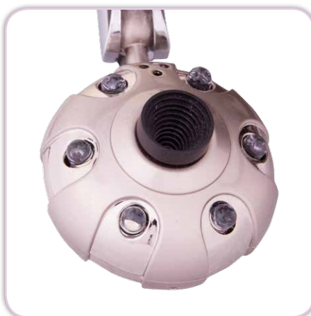
Kamera im Quiltbereich