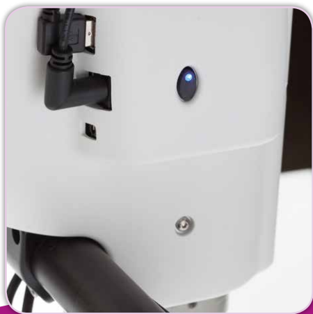
Ein-/Aus-Schalter am Maschinenkopf