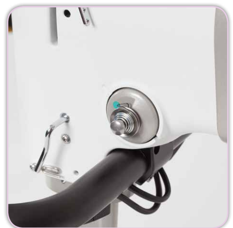
Patentierte digitale Fadenspannungseinstellung per Touch-Screen