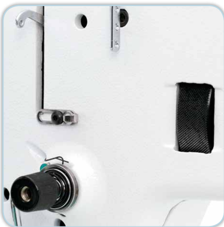
Manuelles Handrad am Maschinenkopf

Für den Profi- und den Hobby-Quilter genau die richtige Maschine. Die Größe der HQ Fusion ist beeindruckend und mit Leichtigkeit schwebt sie förmlich über den Quilt. Das Ergebnis kann sich sehen lassen und Sie werden sich sagen: „Warum besitze ich die HQ Fusion nicht schon seit längerem?“ Gönnen Sie sich die HQ Fusion, steigen Sie auf in das nächste Level der Longarm-Quiltmaschinen und vereinfachen Sie sich das Arbeiten an Ihren Quilts. Mit einem Durchgangsraum von 24 inch erhalten Sie zum Quilten eine Fläche in der Tiefe von ca. 20 inch.