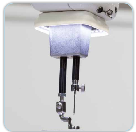
LED-Lichtring im Nadlebereich, warmes, kaltes, neutrales, UV-Licht