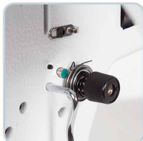
Digitale patentierte Fadenspannungseinstellung