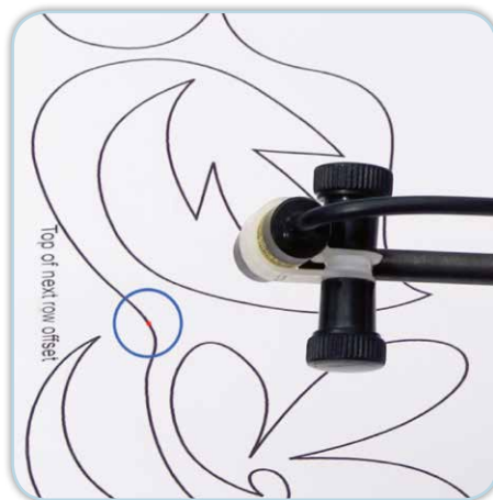
Laser im Einsatz