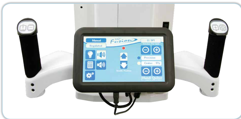
Bedienelement am hinteren Maschinenkopf mit farbigem Touch-Screen, leichte Handhabung durch Knöpfe in den Griffen