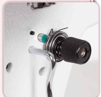
Digitale patentierte Fadenspannungseinstellung