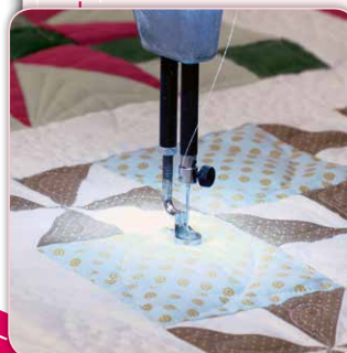
LED-Lichtring mit 28 LED-Lichtern