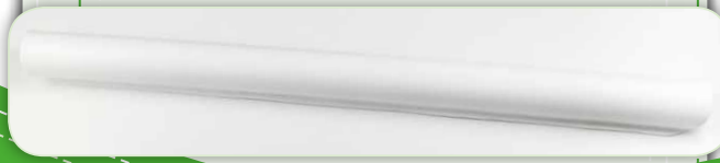
Innovatives Rahmensystem mit Quiltklammern