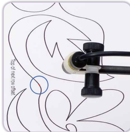
Laser im Einsatz