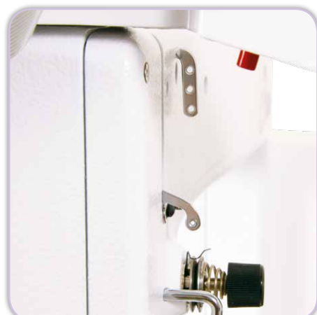
Ein- / Ausschalter am Maschinenkopf