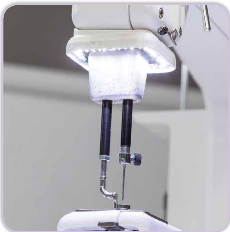
LED-Leuchtring im Quiltbereich

Ihr Durchgangsraum bis 18 inch ist beeindruckend, die Verarbeitung ist hochwertig und präzise und die Stichregulierung erleichtert Ihnen das Quilten enorm. Legen Sie individuell Ihre Stichlänge fest, die Avanté passt automatisch die Nähgeschwindigkeit Ihrer Bewegung an und behält dabei die Stichlänge bei. Apropos Bewegung – hier bewegen Sie die Maschine