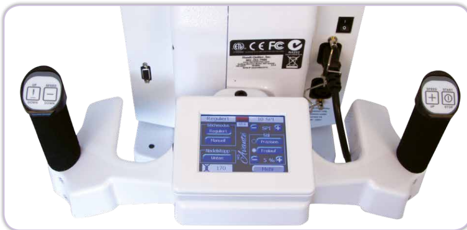
Bedienelement am hinteren Maschinenkopf mit farbigem Touch-Screen, leichte Handhabung durch Knöpfe in den Griffen