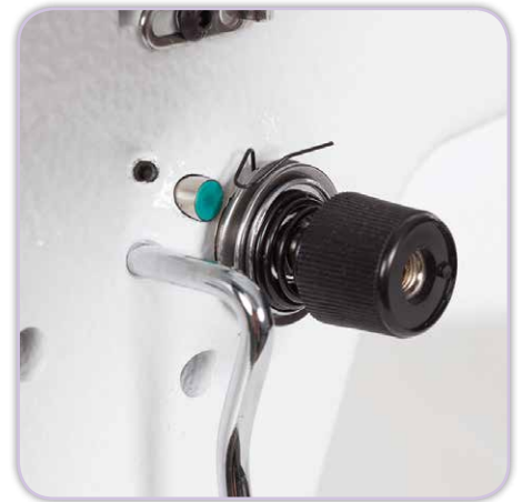
Patentierter digitale Fadenspannungseinstellung