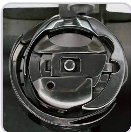
Robuster Doppelumlaufgreifer mit großer Fadenspule